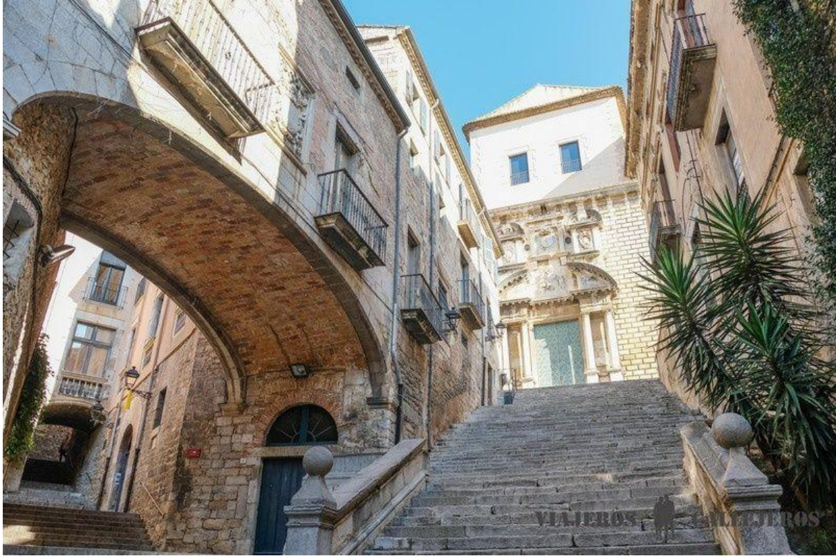
Pujada de Sant Domènec

And remember that before leaving the square of this church you have to kiss the ass of the sculpture of the lioness, to return to Girona.