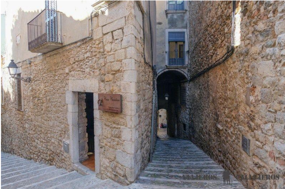
Das jüdische Viertel