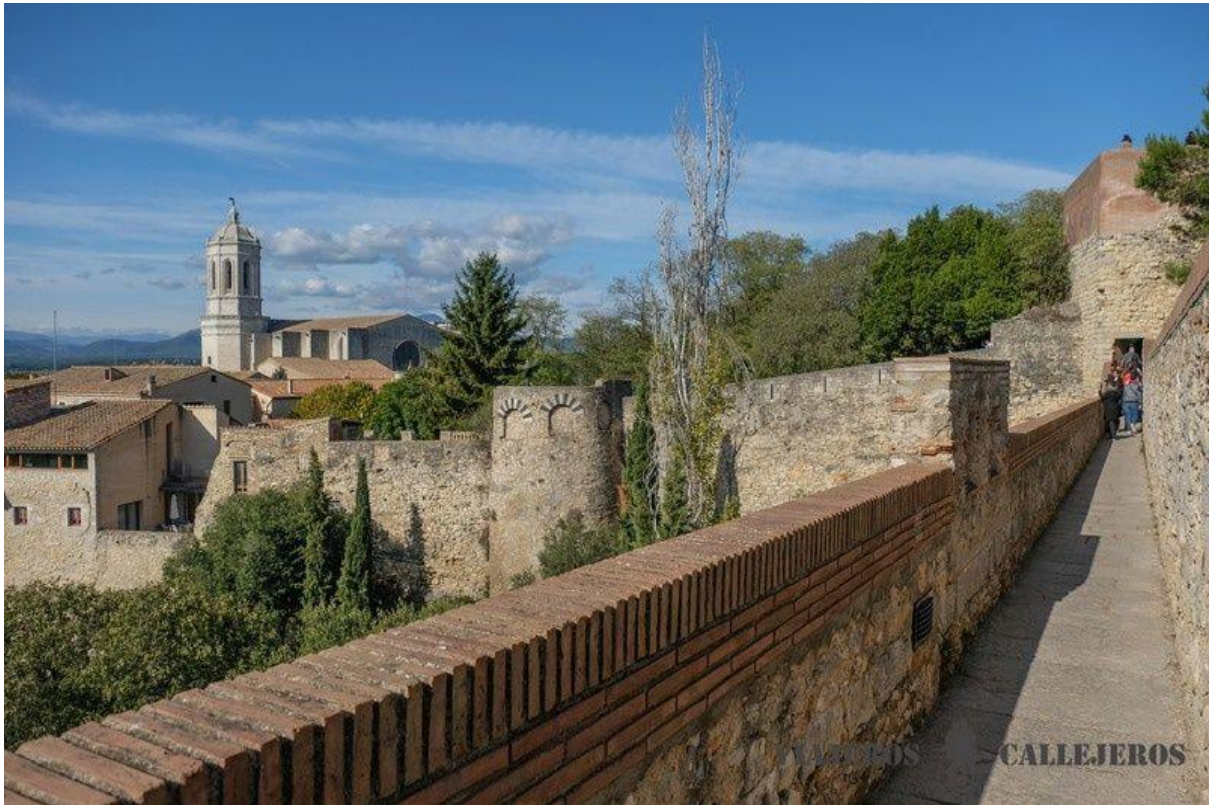
Die Stadtmauer, einer der sehenswerten Orte in Girona

Wir empfehlen, die Mauer bei Sonnenuntergang zu besteigen, um den Sonnenuntergang über der Stadt zu erleben.