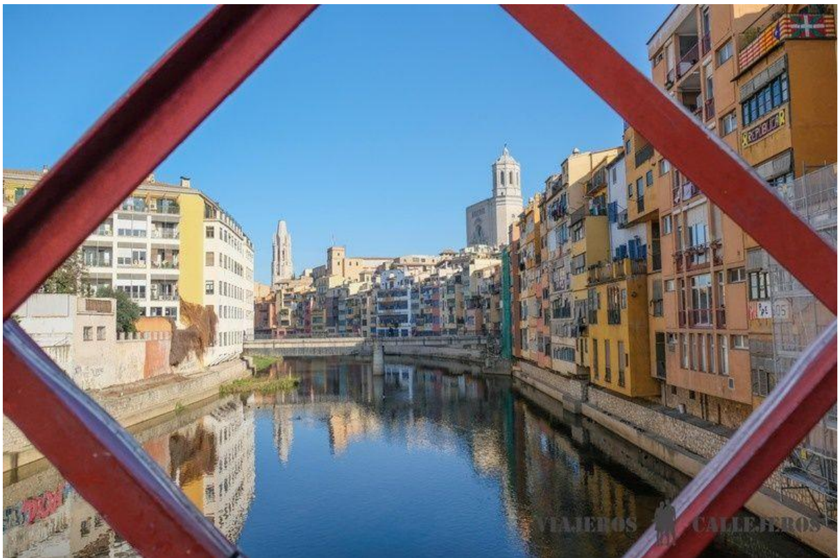
Houses of l'Onyar

A good way to learn about the history of the city and not miss anything interesting is to book this free tour of Girona Free! or this complete tour with tickets, both with English speaking guide.