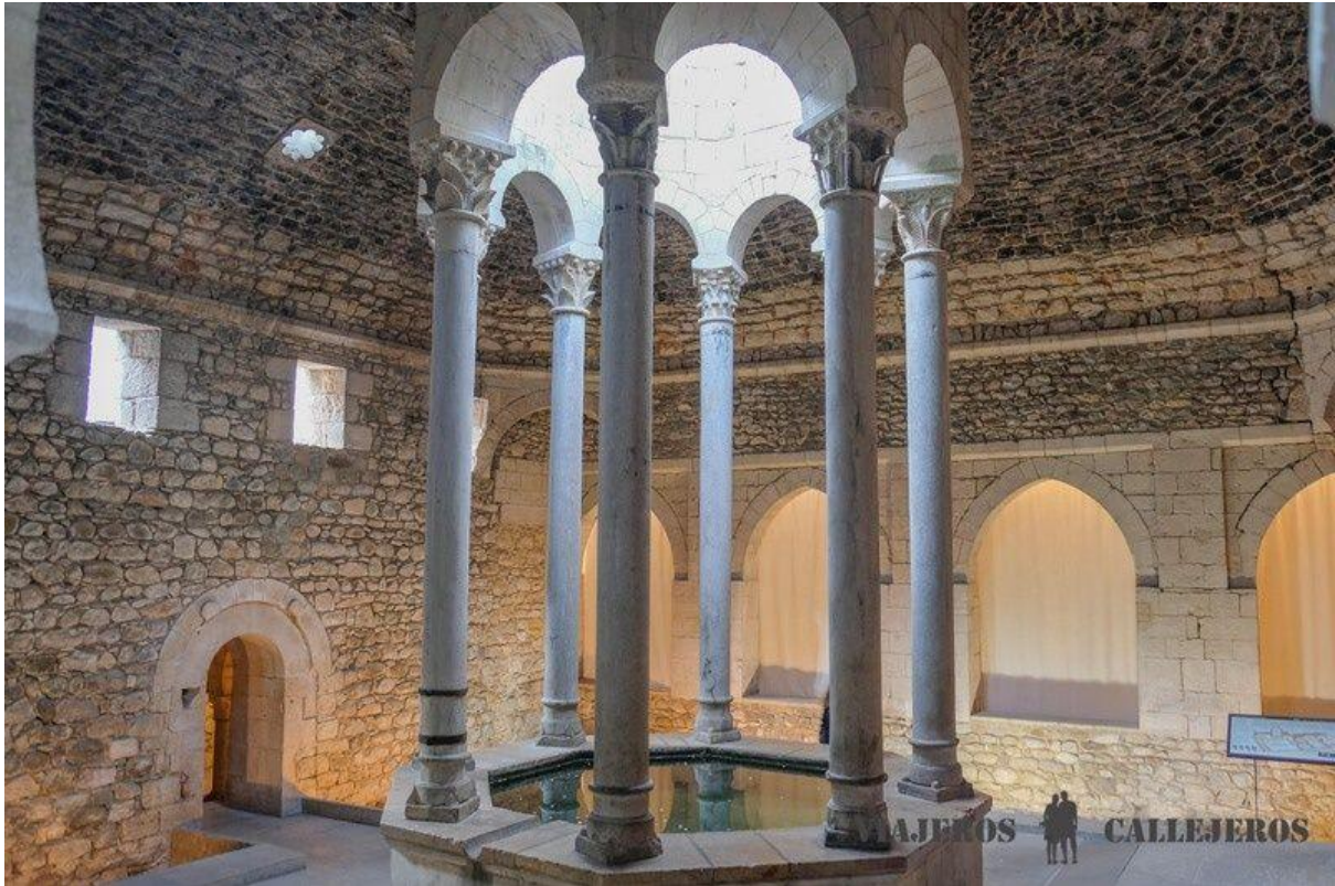
Bains arabes, un des lieux à visiter à Gérone