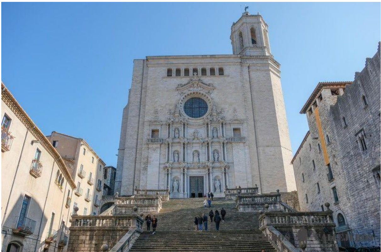
Cathédrale de Gérone

Si vous comptez visiter la cathédrale, il peut être intéressant de réserver cette visite guidée ou ce billet qui inclut également le musée d'art et la basilique de Sant Feliu.