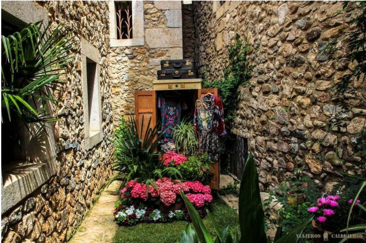
Temps de Flors