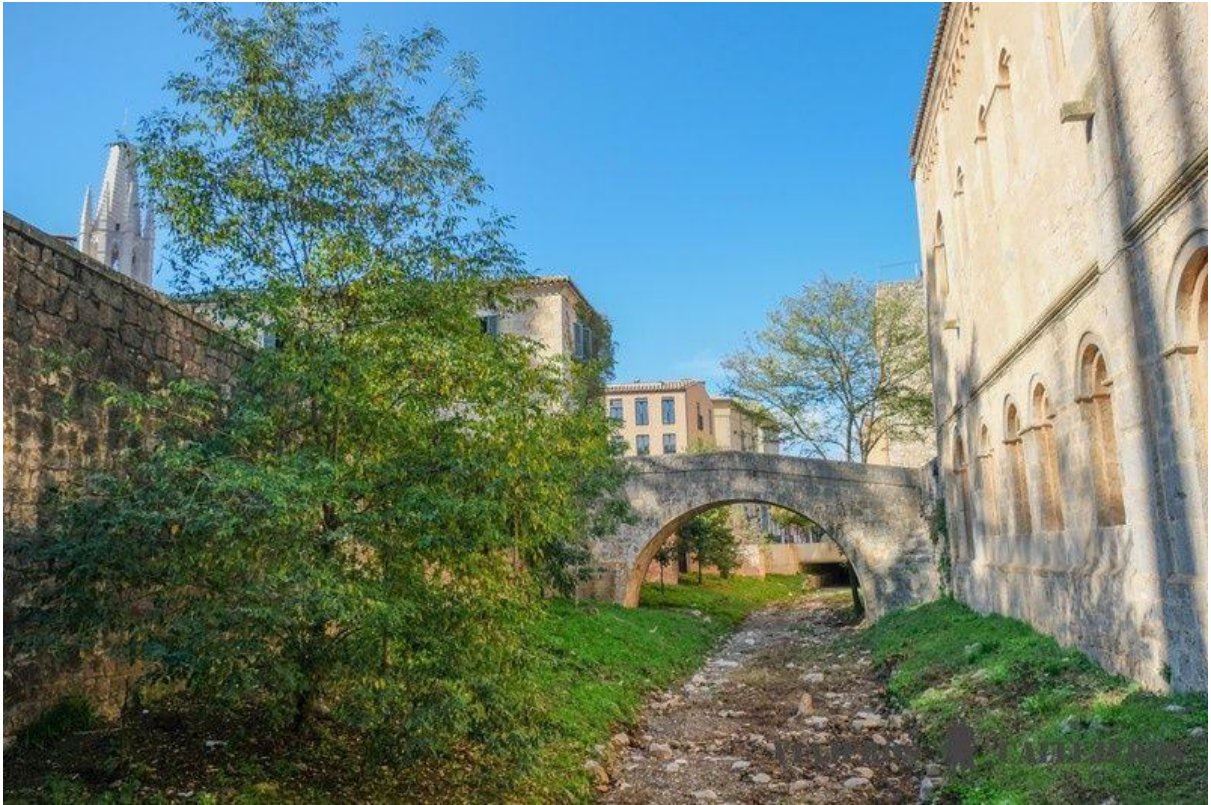
Puente del Galligants