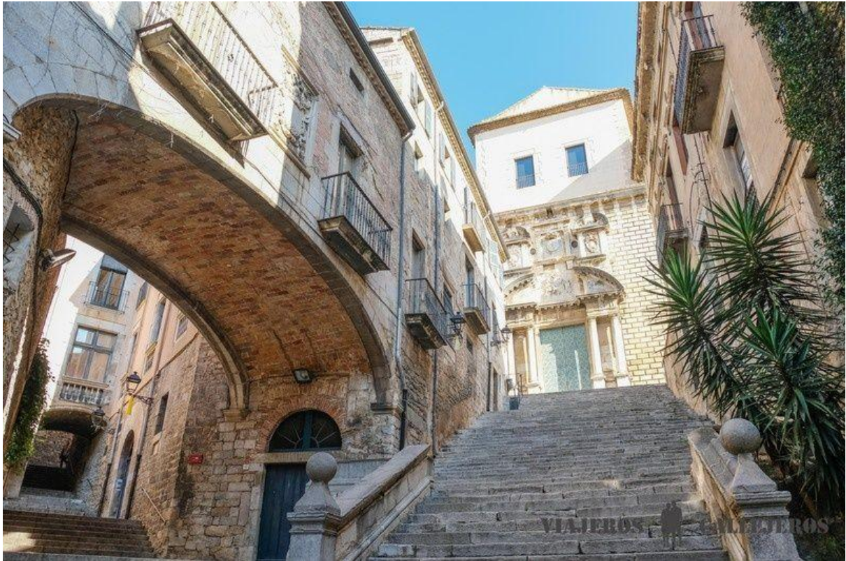
Pujada de Sant Domènec