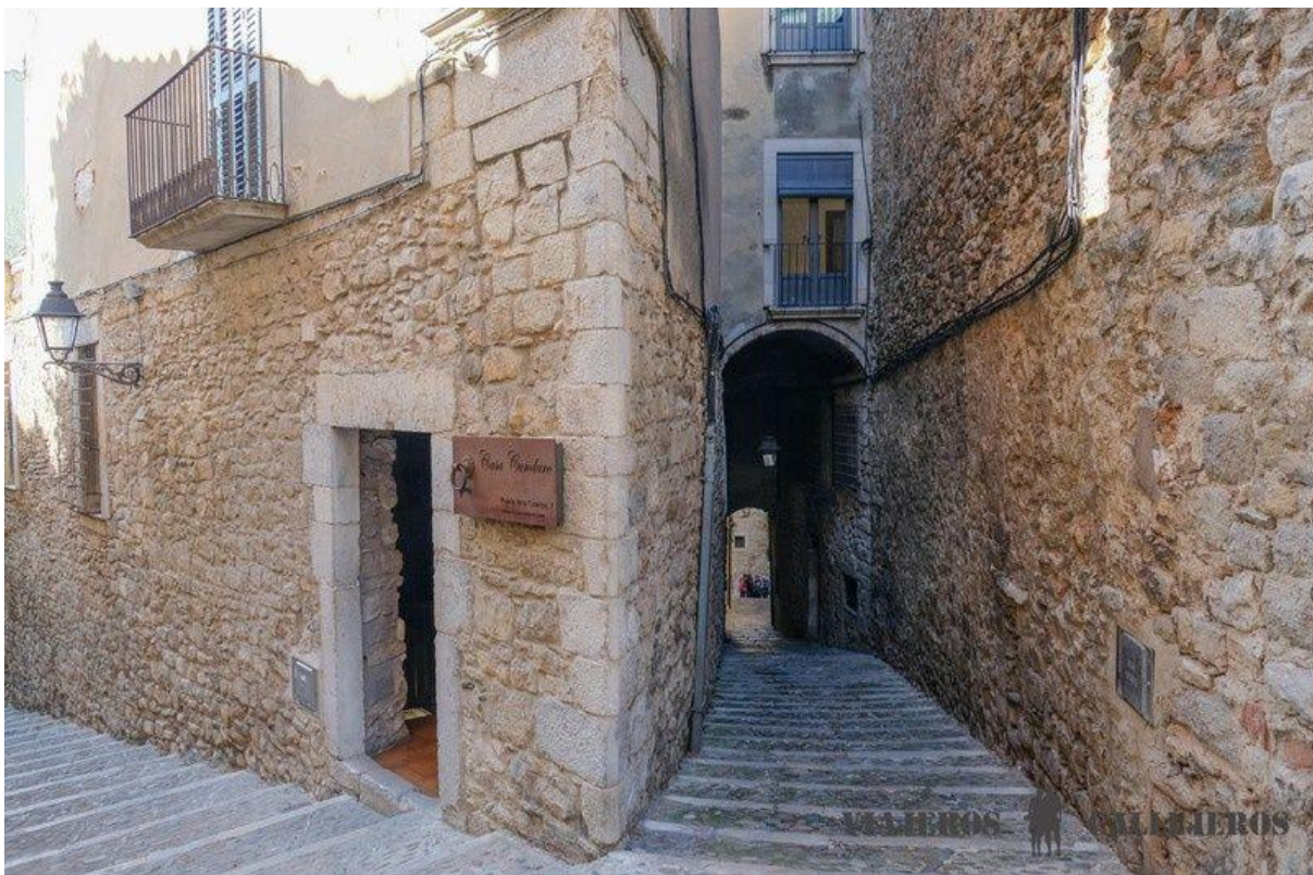
The Jewish Quarter

Museum opening hours: daily from 10h to 18h, Sunday and Monday closes at 14h.