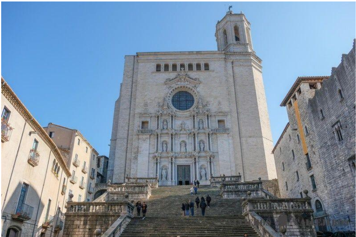
Kathedrale von Girona

Wenn Sie die Kathedrale besichtigen möchten, sollten Sie diese Führung oder dieses Ticket buchen, das auch das Kunstmuseum und die Basilika Sant Feliu einschließt.