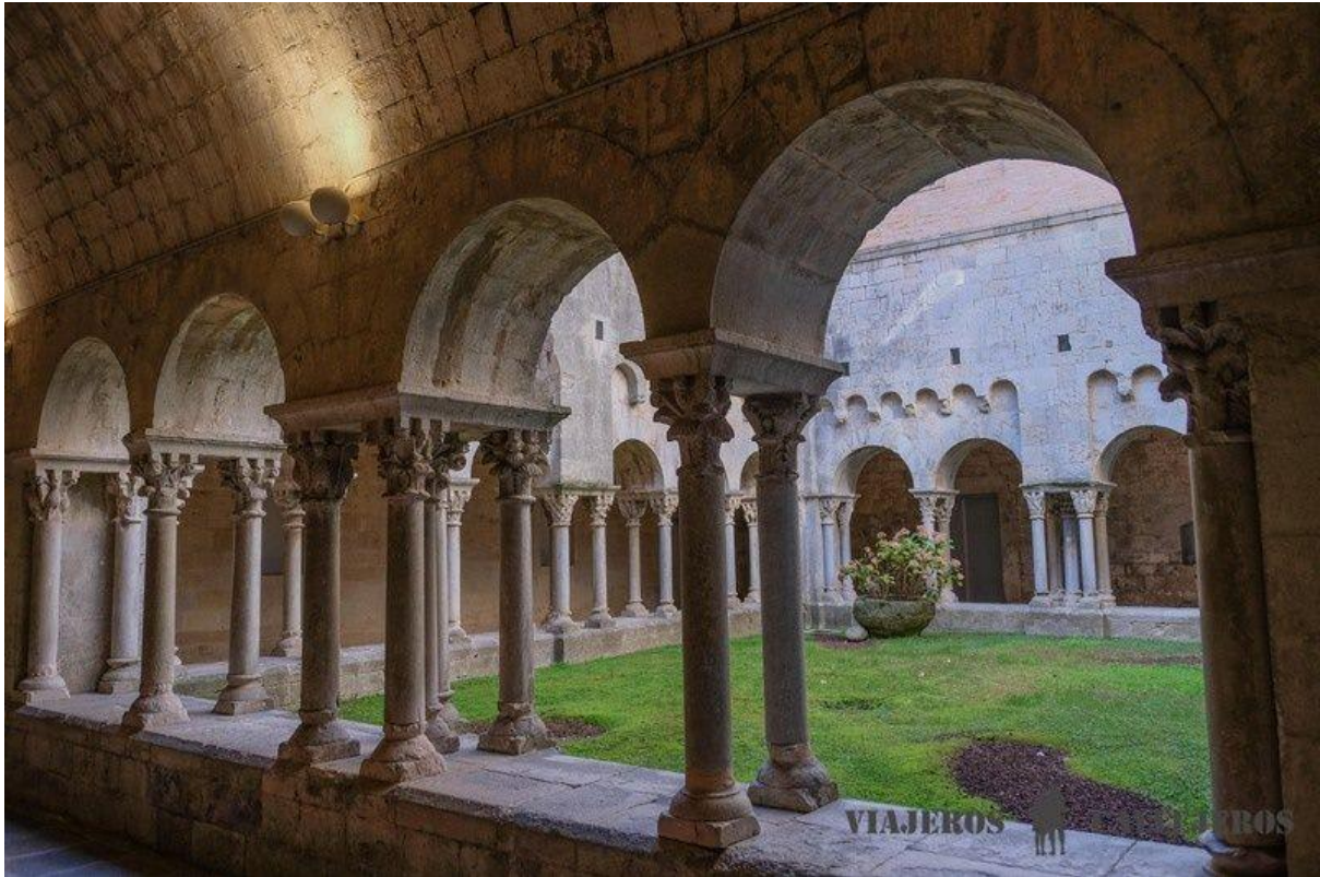
Monastère de Sant Pere de Galligants