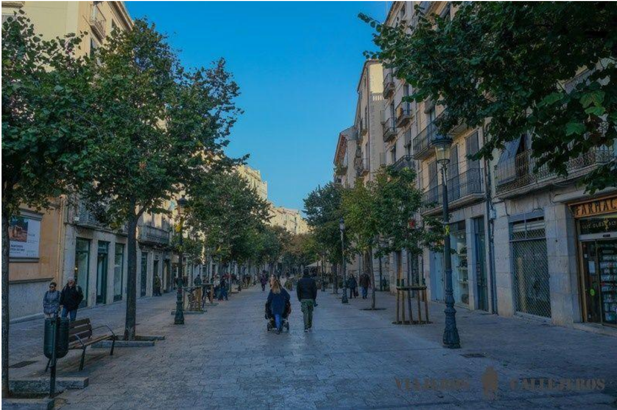
Rambla de la Llibertat